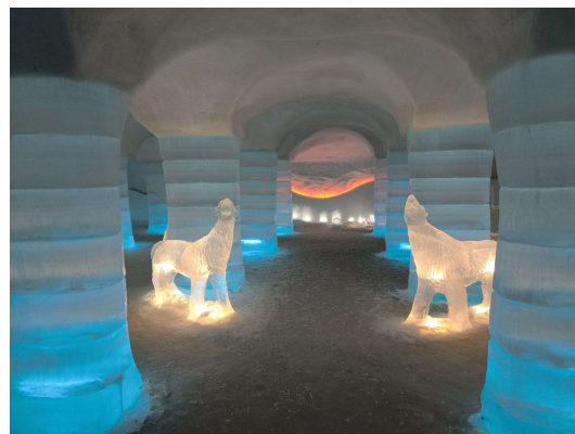
Visite d'un hôtel de glace ( Ice Hotel)