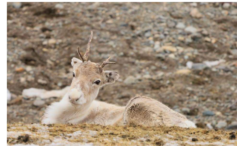
Visite d'un élevage de rennes