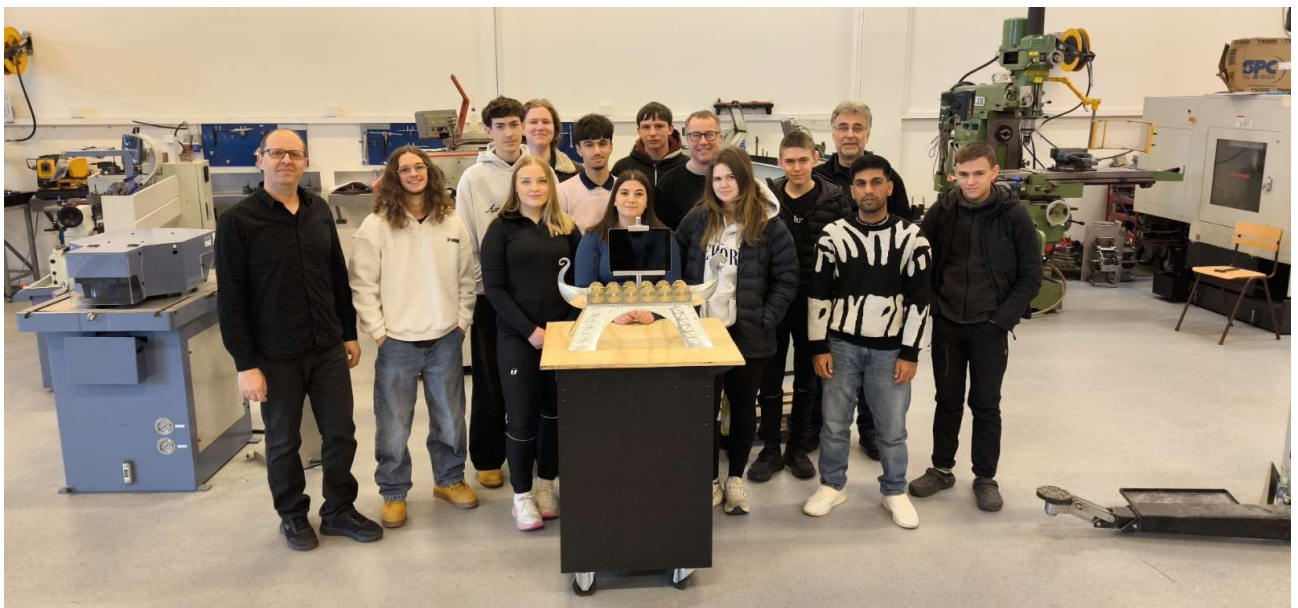
Assemblage du Drakkfel par l'équipe franco-norvégienne