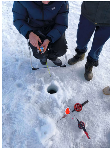
Pêche sous la glace