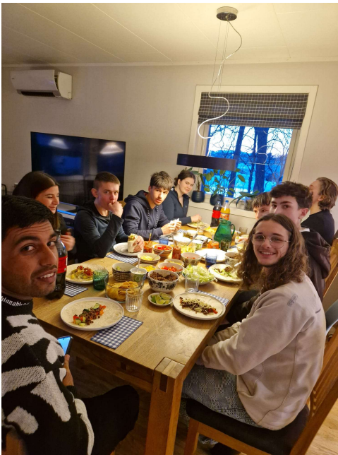
Moment de convivialité entre correspondants