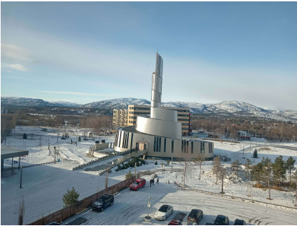
Northern lights Cathedral au centre d'Alta