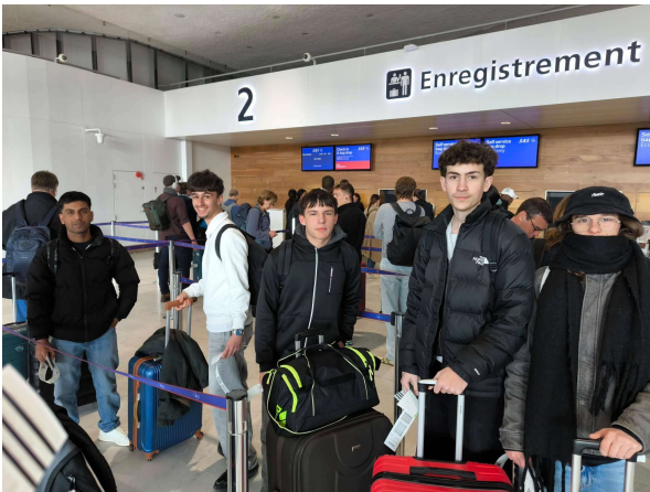
Prêts pour le départ

Les élèves ont profité pleinement d'un séjour très riche en découvertes : vie dans un lycée norvégien, travail en atelier, culture, coutume, gastronomie, environnement...et ont témoigné de leur enthousiasme. Leurs correspondants norvégiens sont attendus à Thouars, la semaine du 20 au 24 avril.